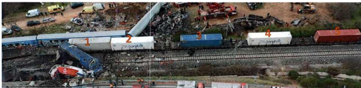
Φωτο 11. Τα 5 πρώτα container του εμπορικού συρμού